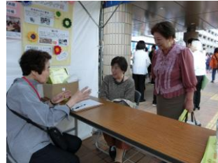
ボランティア活動相談