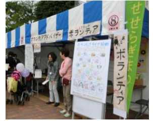
アドバイザーブース

5月14日(日)の「せせらぎまつり」で、ボランティアアドバイザーの活動や、ボランティア室のPR、ボランティア活動の相談コーナーを設けました。たくさんの方に立ち寄っていただきました。