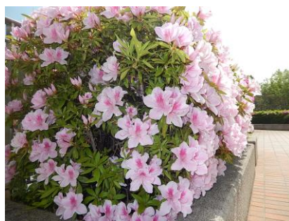
《せせらぎのつつじ》