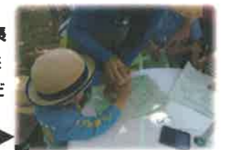
10:30 人気のスタンプラリーには多くの子どもたちや親子連れで参加！