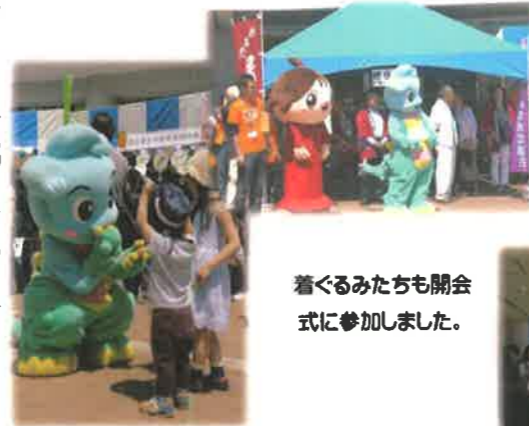
着ぐるみたちも開会式に参加しました。