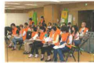
7:40 実行委員が集合 今日一日の流れを確認。 早朝から ありがとうございました

5月10日(日)晴天の下で、せせらぎまつりが行なわれました。 来場者4,500人。開会式から閉会式まで、たくさんの笑顔の中でおまつりが終わりました。ご協力いただいたボランティア、テント参加のみなさん、歌や踊りで盛り上げて頂いたみなさん！ありがとうございました。来年もお会いしましょう！