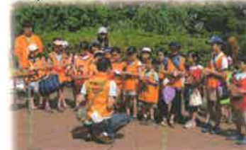
14:10 「この人を探せ in せせらぎ」 始まりました♪見つかるかな～