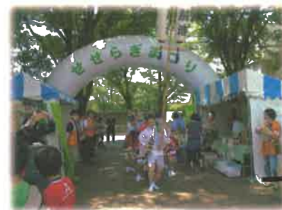
阿波踊りの練り歩き