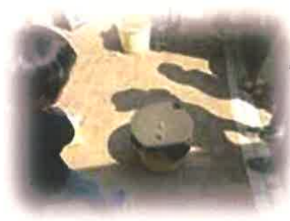
昔あそびコーナー