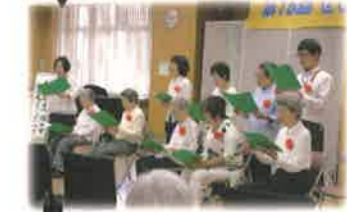
屋内発表 歌や演奏、ダンス日頃の練習の成果を！