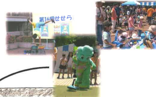
2階のステージでは、ジャグリング・バルーンゲーム・ユニカール！