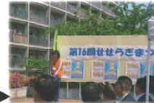
10:00 開会式 実行委員長、社協会長、区長のあいさつがあり、多くの来賓のみなさんにお越しいただきました。