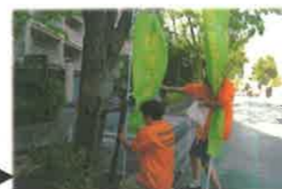
9:00 ボランティア集合 実行委員やボランティアたちが、会場のおちらこちで準備を進めています。