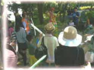
Mr.GGのバルーンアート教室。