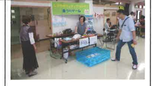
夏・体験ボランティア (8月)