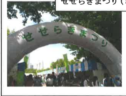
せせらぎまつり (5月)