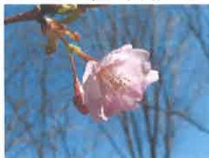
《せせらぎの河津桜》

写真の桜は一昨年社会福祉協議会の法人化50周年で植樹したものです。一足先に河津桜が春を感じさせてくれます。花の時期が1ヶ月と長いので、ゆっくり楽しめますよ。